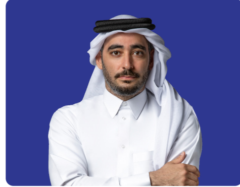
الشيخ خالد بن نواف آل ثاني عضو مجلس الإدارة