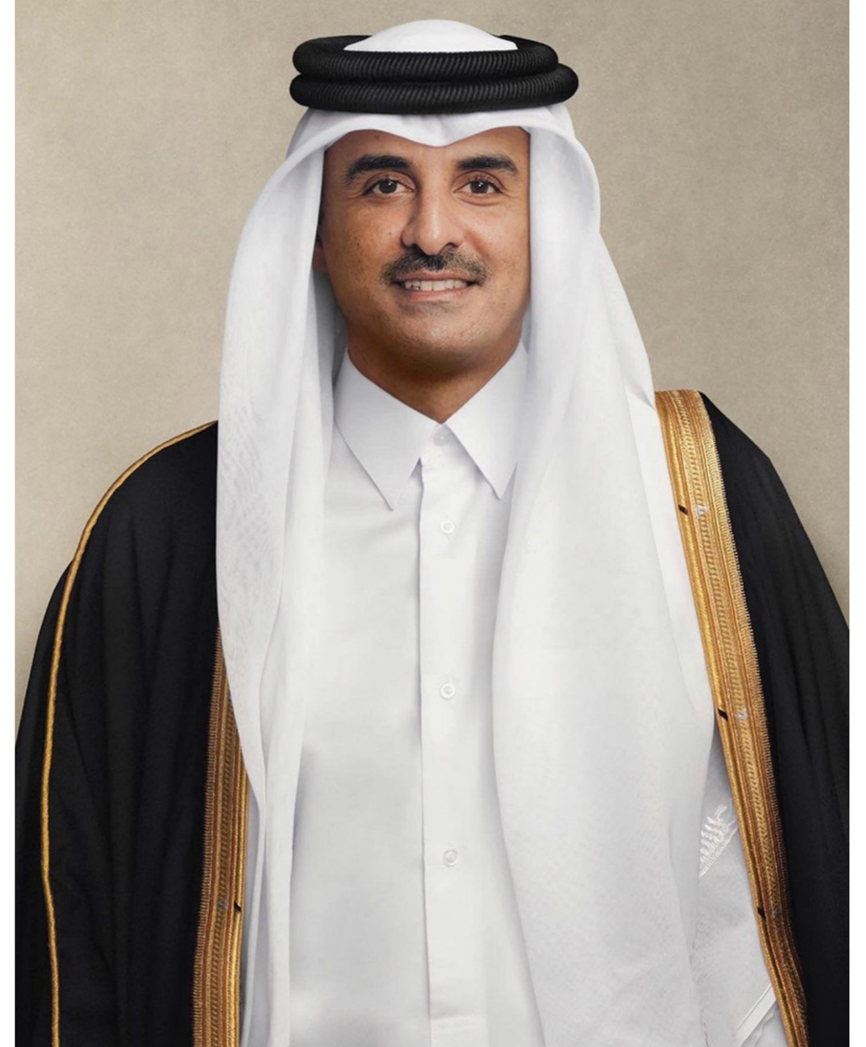
حضرة صاحب السمو الشيخ تميم بن حمد آل ثاني أمير دولة قطر