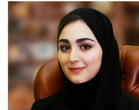
الشيخة أنوار بنت نواف آل ثاني الرئيس التنفيذي

إنجازتنا والنتائج التعليمية لطلابنا: في العام الماضي، سجلت شركة الفالch التعليمية القابضة ٢١٥٠ طالباً في المدارس و ٦٨٠ في الجامعة، مما يدل على استقرارنا وموقعنا الثابت كمجموعة تعليمية رائدة. بالإضافة إلى ذلك، تم منح فرعي أكاديمية الدوحة - الوبع وسلوى - اعتماد مدارس قطر الوطنية (QNSA)، مما يؤكد أن برامجنا تلبي متطلبات الأداء والجودة الدولية. علاوة على ذلك، استمر الطلاب في الصفين ١١ و ١٢ في تحقيق أعلى الدرجات في الامتحانات الدولية، كما حدث في السنوات الأكاديمية السابقة، حيث حصل ٨٦٪ من طلاب الصف ١٢ لدينا على درجات متفوقة في اختبارات الـ AS Levels.