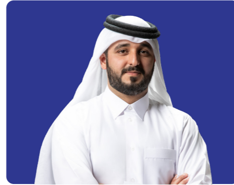
الشيخ محمد بن نواف آل ثاني عضو مجلس الإدارة