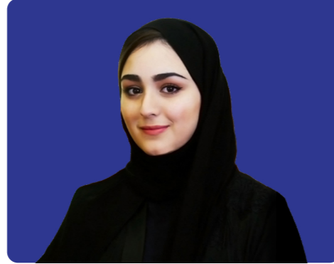
الشيخة أنوار بنت نواف آل ثاني الرئيس التنفيذي